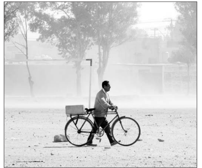
Clima. Hace unos días se registraron rachas de viento de hasta 105 kilómetros por hora en la región de los valles.