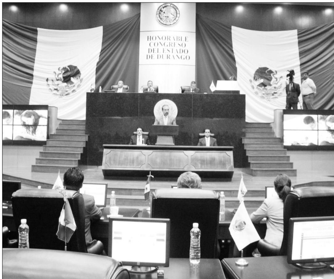
Inversión. El funcionario admitió que resultó insuficiente el millón 175 mil pesos que la SEED invirtió para promover la actividad física en la educación primaria y combatir la obesidad, pero se benefició a 104 mil 079 alumnos.